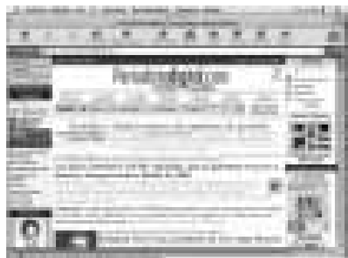
www.periodistadigital.com es defineix com el periòdic dels periòdics i intenta mostrar una òptica diferent

Una mica diferent de l'anterior és periodistadigital.com . Ella mateixa es defineix com "el periòdic dels periòdics", i funciona com qualsevol altre diari electrònic, amb la diferència que els temes que tracten són enfocats des d'una òptica un xic diferent. Es pot accedir de manera directa a altres pàgines de característiques similars, com ara El Confidencial.com , El Martillo , Diario Directo o El Semanal Digital , per posar alguns exem-