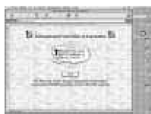
La web de la FIP, www.ijf.org , ofereix molta informació sobre la realitat de la professió en molts punts del planeta

pàgina de la Federació Internacional de Periodistes (FIP), que agrupa més de 500.000 informadors de més de 100 països. A www.ijf.org es troben enllaços a la pràctica totalitat de sindicats de periodistes d'arreu del món, així com de tota mena de campanyes en les quals la professió està involucrada als diferents països. S'hi poden trobar les últimes informacions sobre la persecució de professionals de la informació tant als països amb les llibertats restringides o en conflicte com en els que, aparentment, els drets cívics i socials estan perfectament reconeguts. La web és consultable en anglès, francès i espanyol.