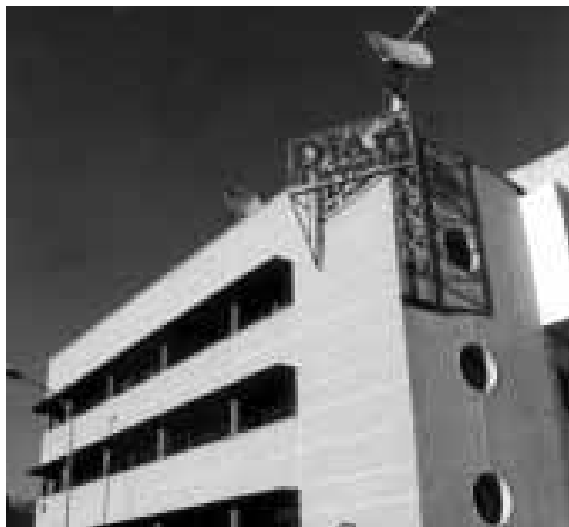
Edifici que allotja les instal·lacions del Diari de Tarragona

"Amb els nous contractes als col·laboradors es pretén que aquests renunciïn als drets d'autor a perpetuïtat"