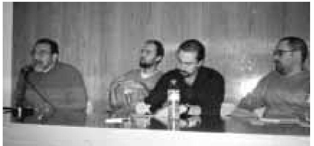
Jornada de debat del Sindicat de Professionals de la Informació de la Rioja, a Logronyo

L'SPIR té com a objectiu immediat la confecció d'un calendari per a convocar eleccions sindicals als mitjans de la Rioja i presentar-s'hi amb llistes pròpies. En el seu primer any d'actuació, els periodistes afiliats al sindicat de La Rioja, un dels cinc que formen part de la FeSP representa el 25% del cens dels periodistes d'aquesta Comunitat.