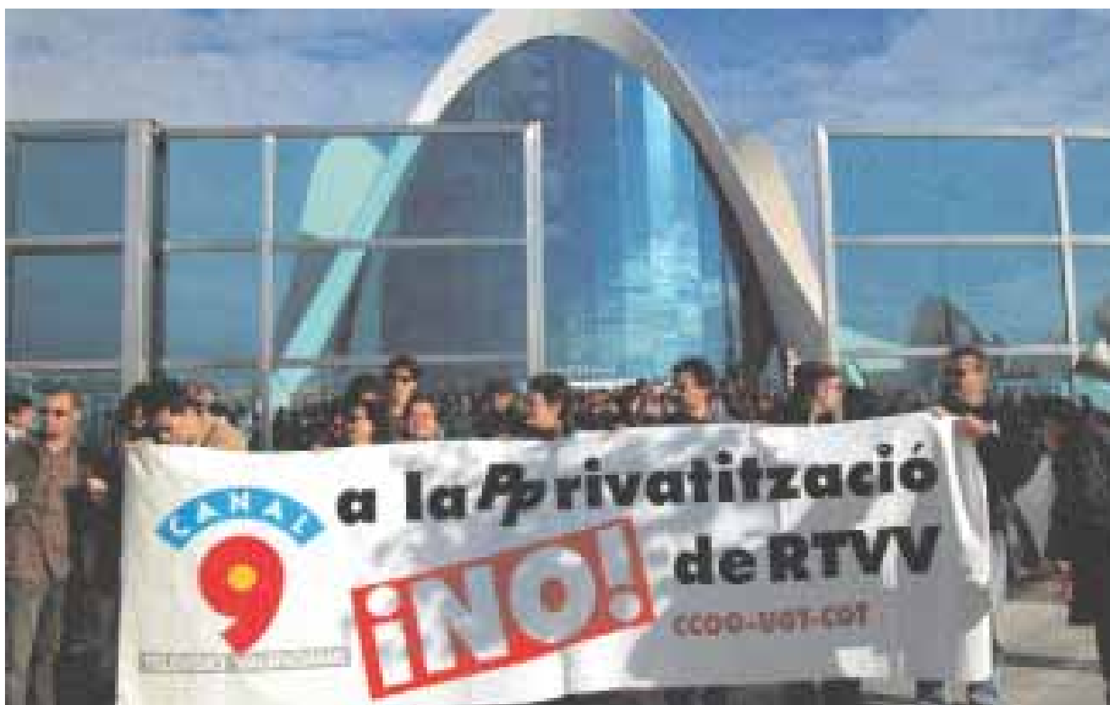
COMITÈ D'EMPRESA D'RTVV

El 2002 s'ha caracteritzat pels greus atacs a la llibertat d'expressió i a la independència dels mitjans públics