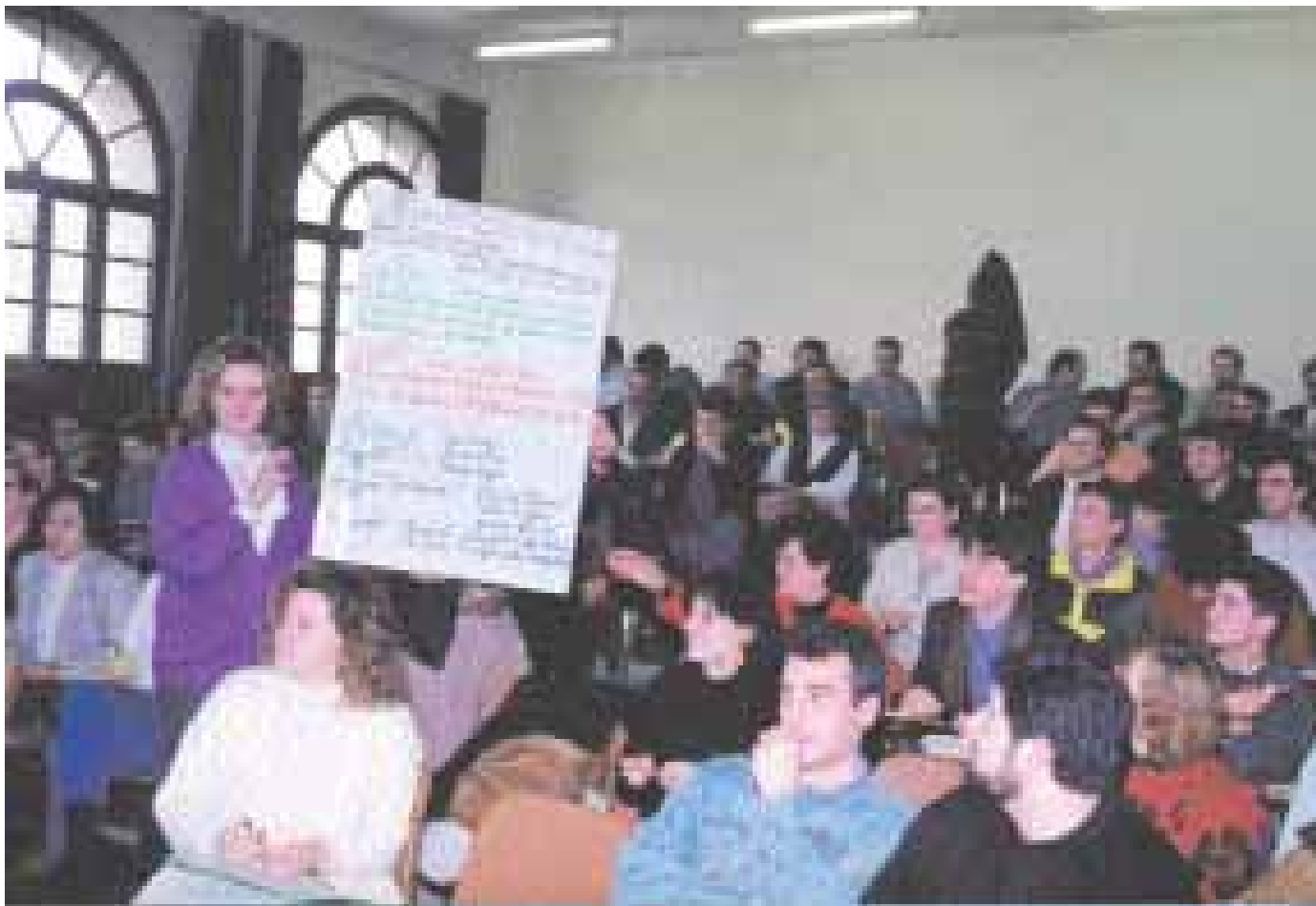
L'assemblea celebrada a Sant Cugat el mes de febrer de 1993 va donar el tret de sortida a la creació de l'SPC

El mes de febrer de 1993 es va posar en marxa formalment el procés de constitució de l'SPC amb una assemblea celebrada al Casal Borja de Sant Cugat -a la qual pertany la fotografia que reproduïm en aquest pàgina- i on es va escollir la comissió gestora que va organitzar el Congrés fundacional. Aquest es va dur a terme a les Cotxeres de Sants el mes de juny del mateix any.