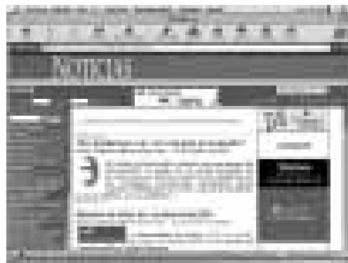
A www.prnoticias.com disposen d'un servei que es dedica a llegir entre línies i a rastrejar allò que pot enganyar el lector

objectius són "servir a les organitzacions i les persones que treballen pel canvi i la justícia social". Des d'aquest portal es pot accedir a diverses campanyes, com les de l'ajuda a Galícia pel cas del Prestige , o opcions com la de Demos i que es subtitula "Repensant la democràcia".