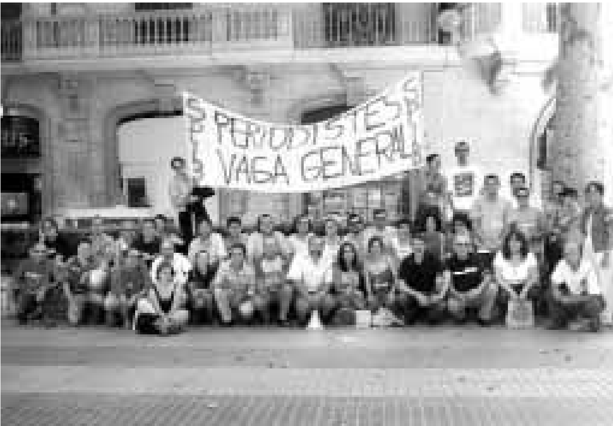
FOTÒGRAFS EN VAGA DE L'SPIB