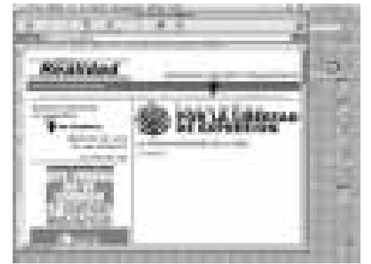
www.otrarealidad.net , periodisme combatiu a Cantàbria, amb el rerefons de la mort polèmica d'una revista: La Realidad

Un altre dels nostres temes d'aquest Fil Directe , el de la necessitat de reformar urgentment la Llei d'enjudiciament civil (LEC), té una evident plasmació a la pàgina web dels qui volen reflotar el setmanari càn-