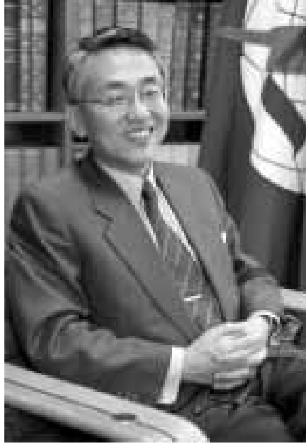
Conferència regional preparatòria de la cimera celebrada a Bamako, capital de Mali. A la dreta, el secretari general de la UIT, Yoshio Utsumi

seva veu". De fet, l'UIT, el principal organisme organitzador de la WSIS, és en aquest moment l'organització de les Nacions Unides més exitosament semiprivatitzada. Set de les multinacionals de telecomunicacions més importants -és a dir, Siemens, Motorola, Bell, Nec, Alcatel, Ericsson i AT&T- formen part del seu principal òrgan consultiu des de 1992. Fins i tot es dona el cas de corporacions que es troben triplement representades: en les delegacions del sector privat, en les de la societat civil i en les del sector de les organitzacions internacionals. Tenint en compte a més la influència que les multinacionals poden tenir sobre les delegacions governamentals dels seus països de capçalera (és inimaginable que