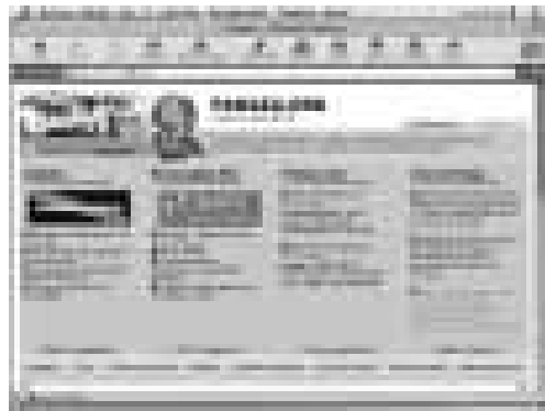
Des de pangea.org es treballa per servir a les organitzacions i les persones que treballen pel canvi i la justícia social

Com que no tot és donar informació, crear opinió i entretenir, sinó que també ha d' haver-hi temps i espai per a la solidaritat, una de les possibilitats és visitar la pàgina www.pangea.org , que anuncia que els seus