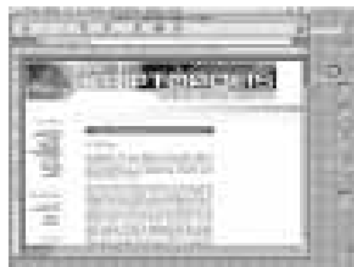
www.kriptopolis.com han liderat sempre la lluita per la llibertat d'expressió a la xarxa i contra la LSSI elaborada pel PP.

Una web imprescindible per resseguir l'actualitat de la professió arreu del món és la