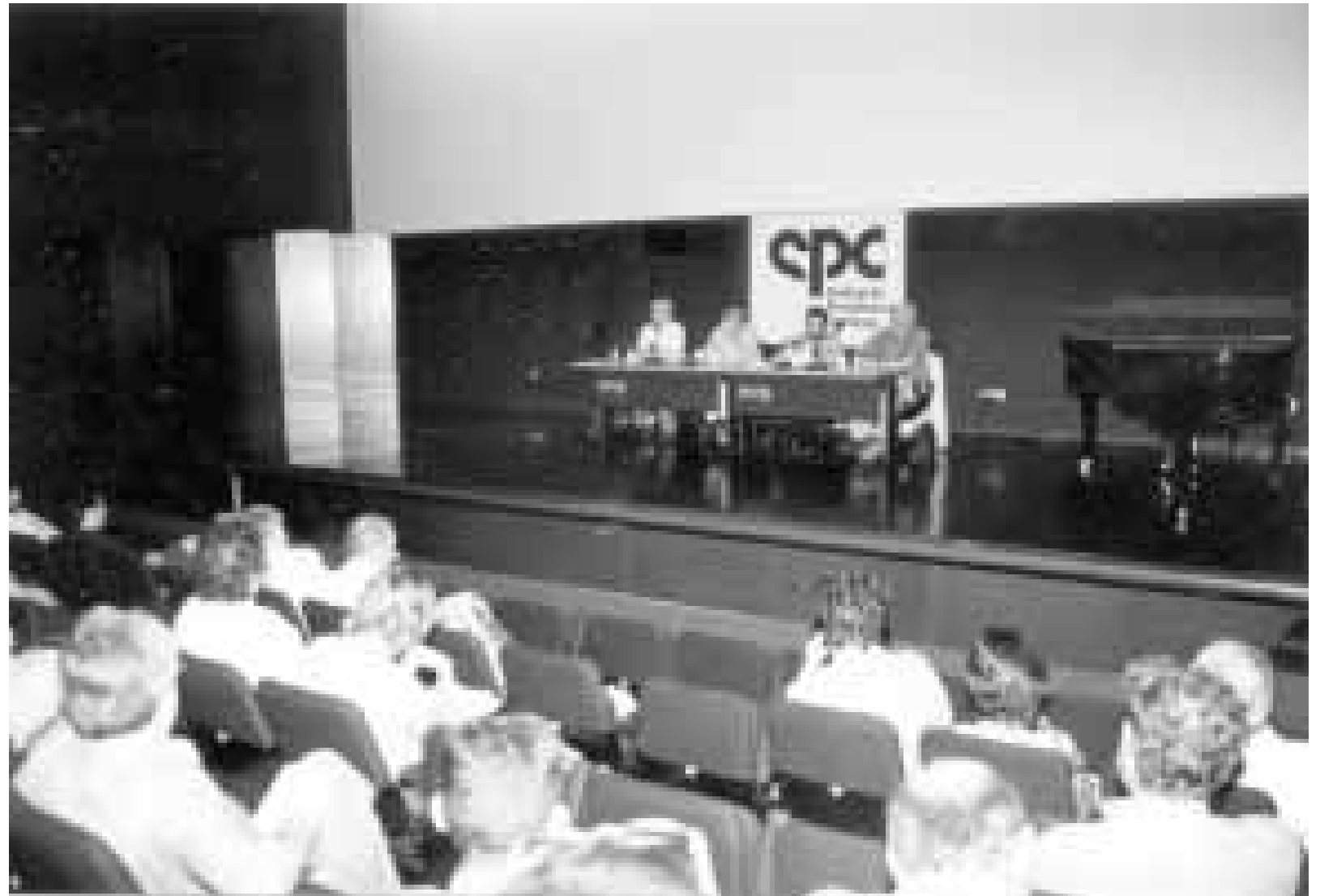
L'SPC va organitzar l'any passat un debat públic sobre globalització i comunicació, que es va celebrar al CCCB de Barcelona

En aquesta situació, la televisió hi juga un paper fonamental. Només cal que una notícia sigui llençada per aquest mitjà, perquè a les poques hores sigui acreditada com a verdadera, sense més exigències. La premsa, per la seva