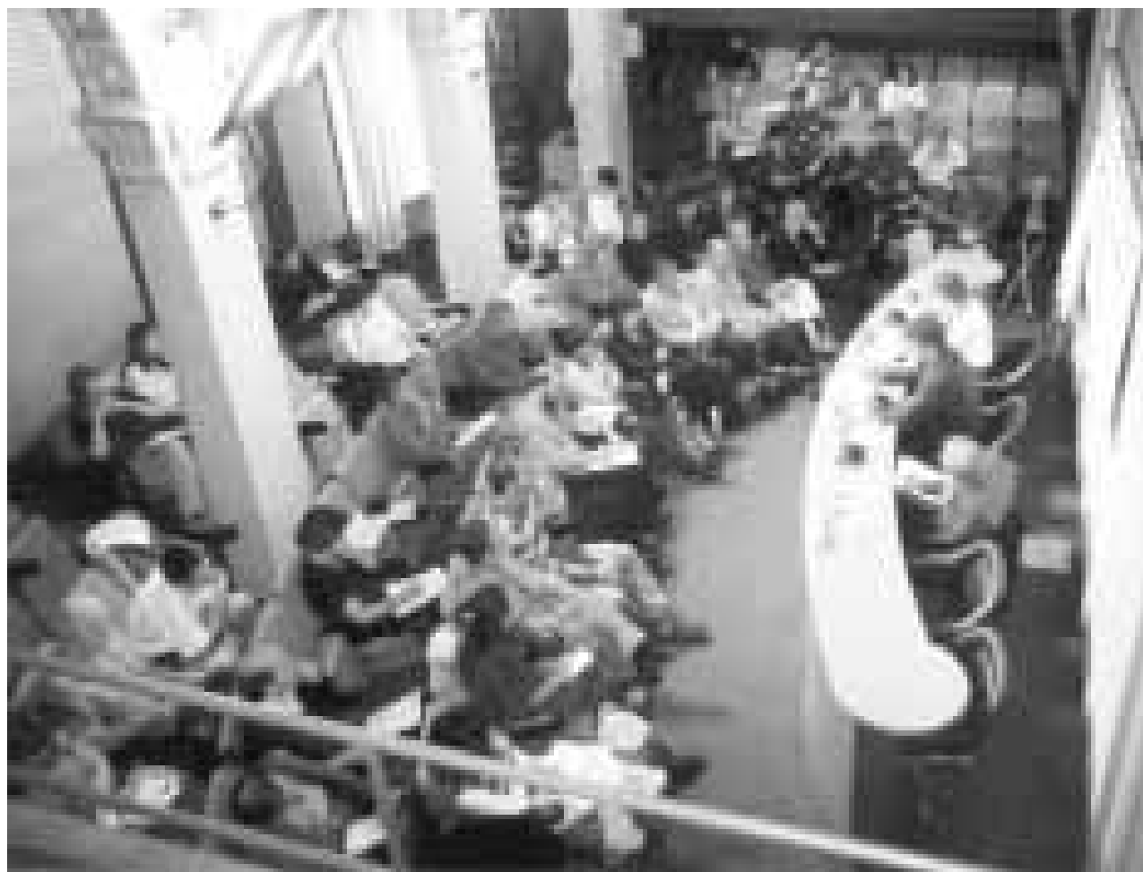
La Jornada Anual dels Periodistes Catalans de l'any passat va clamar per la democratització dels mitjans públics

La lluita pel dret a la informació és tan necessària com la defensa d'un sistema públic sanitari o de l'ensenyament