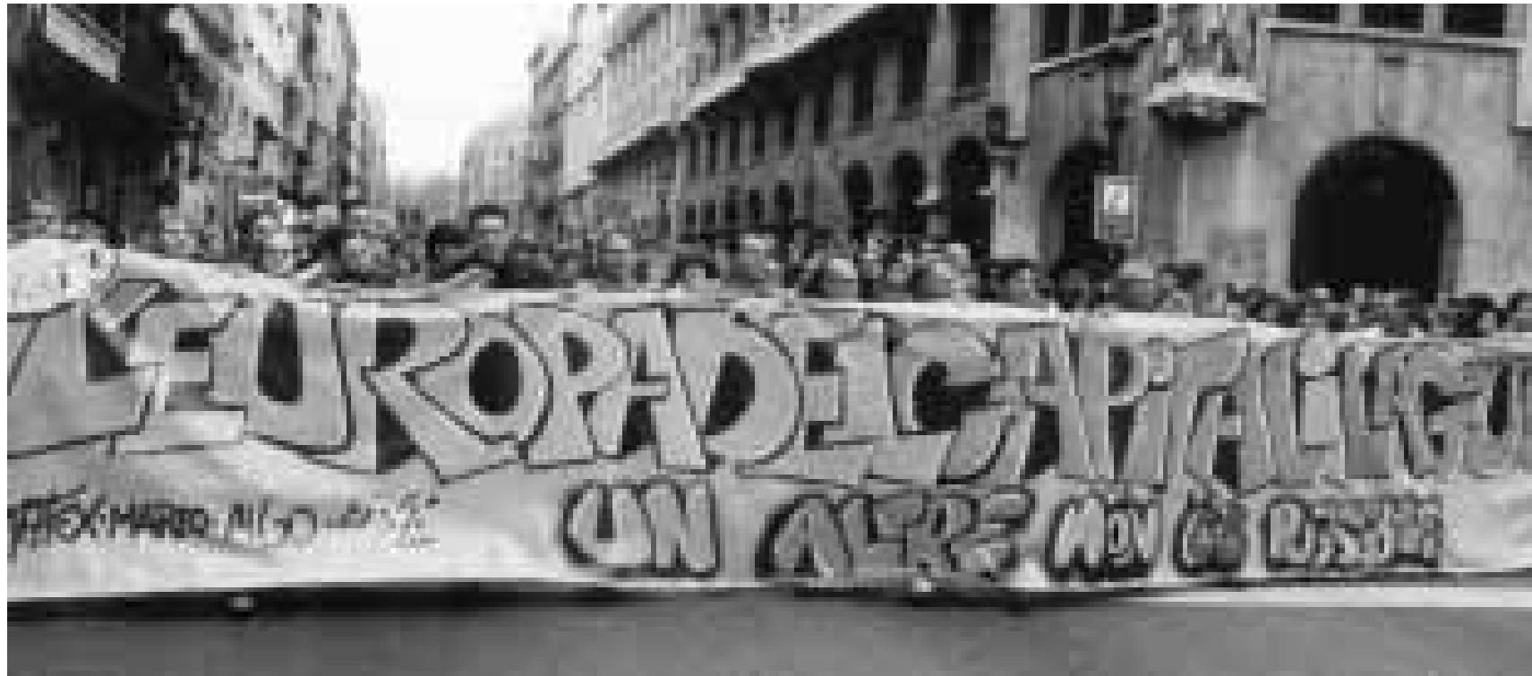
La plataforma "Contra l'Europa del capital", en la manifestació celebrada a Barcelona el passat 16 de març, un dels col·lectius crítics amb els periodistes

No es tracta de donar lliçons a ningú, sinó que entre tots intentem millorar la nostra feina i conscien-