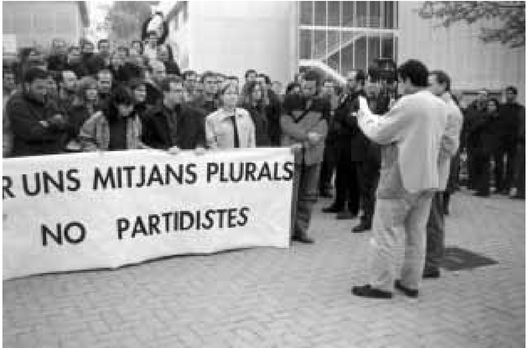
La darrera de les mobilitzacions dels treballadors de la CCRTV, a les instal·lacions de TV3, a Sant Joan Despí

És el cas de l'Iniciativa Legislativa Popular (ILP), impulsada en l'inici per més de 300 professionals de la RTVG, que ja ha entrat al Parlament galleg i que, amb suport sindical i del Col.legi de Periodistes de Galícia, reclama l'elecció parlamentària del director general de la ràdio i televisió autonòmica. El de la plataforma en Defensa de la RTVV, impulsada pels comitès de redacció, comitès d'empresa i sindi-