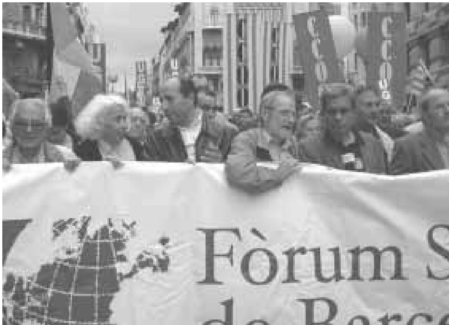
El Fòrum Social de Barcelona (FSB) en la darrera manifestació a Barcelona en motiu del Primer de maig