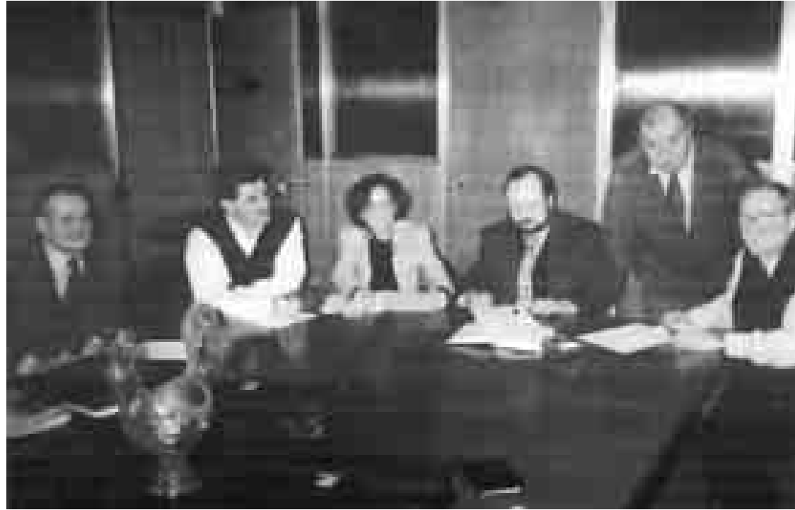
La darrera reunió del Fòrum d'Organitzacions Periodistes d'Espanya celebrada a Madrid

des del nostre origen, però sí una readequació per tal d'afrontar amb èxit les exigències d'un moment especialment intens en la vida del Sindicat. Esperem que l'inventari al final del present mandat reculli avenços notables de la situació, tanmateix fràgil encara, dels i les periodistes no només de Catalunya, sinó també del conjunt de l'Estat.