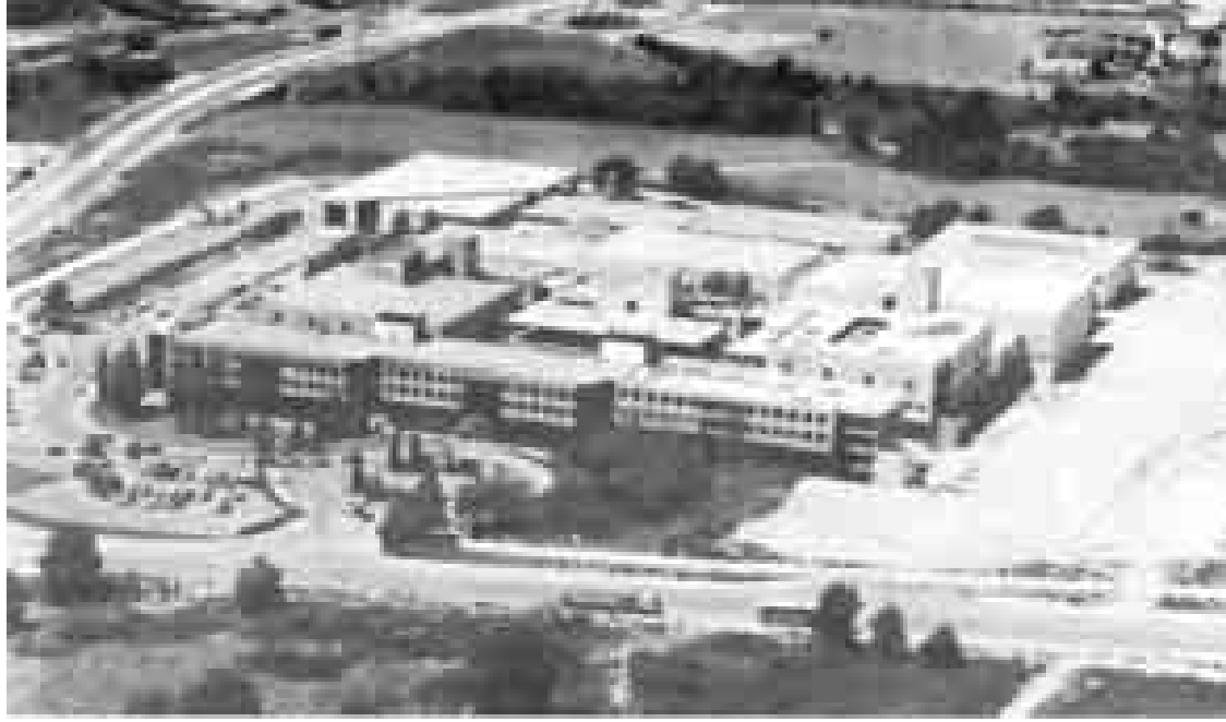
Edifici de Televisió Espanyola a Sant Cugat, on fa tres mesos que funcionen sense director